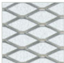
White (valkoinen), NCS S 1000-N