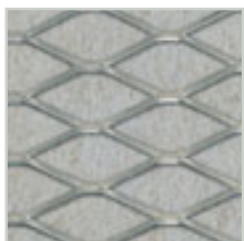
Natur (luonnonharmaa), NCS S 2005-G80Y